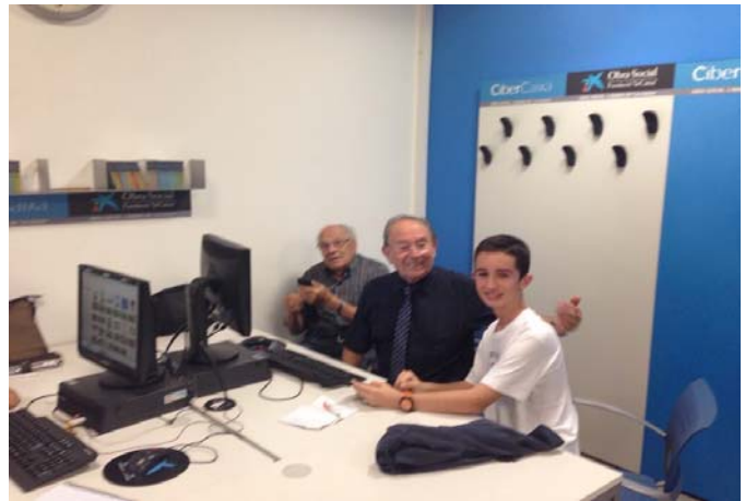
Aprendizaje con los ordenadores