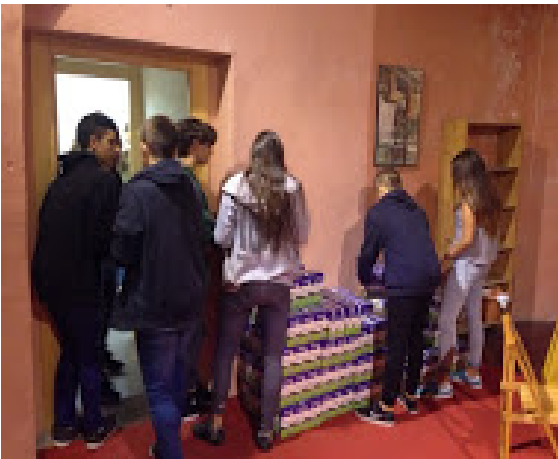
Recogida y almacenamiento de los alimentos.

trimestre se está colaborando con el Casal de Abuelos Gaudí (de la fundación La Caixa) y con la Comunidad de Sant Egidí. Con la primera entidad se realiza un intercambio de conocimientos: una parte de los alumnos enseña informática a la gente mayor y a cambio la gente mayor hacen un tipo de vivero de experiencias. En este vivero se explican y comparten temas y vivencias que van desde la Guerra Civil en la educación que recibían, pasando por el papel de la mujer en la España franquista o los juegos tradicionales. Todos los jueves de noviembre, han participado en este programa de intercambio de experiencias con el Casal. También han colaborado con la recogida de alimentos para la comunidad de Sant Egidí y poder ayudar así a familias con problemas socioeconómicos. Os dejamos unas imágenes porque los veáis en acción.